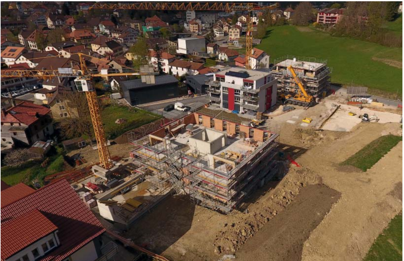
Quartier Clos Guyenet à Couvet en cours de réalisation