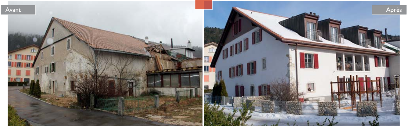
Domotis SA a transformé cette ferme vétuste de Dombresson en huit logements de qualité