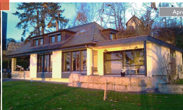
L'exemple réussi d'une rénovation de villa à Chez-le-Bart