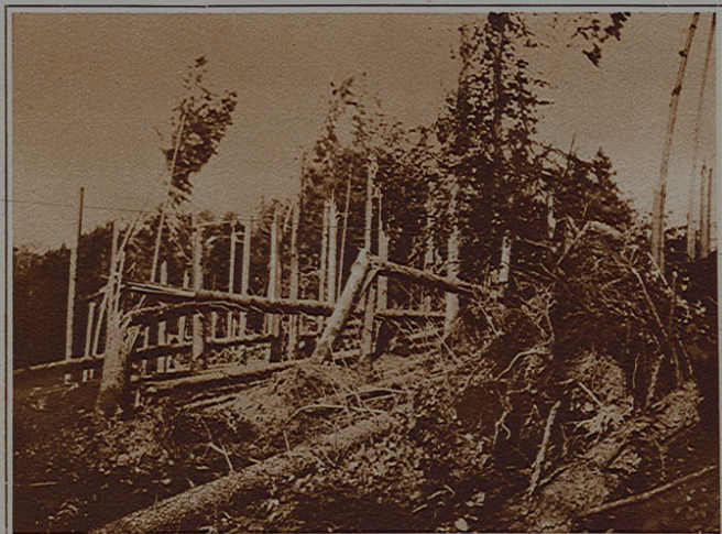
Les effets de l'ouragan du 6 juillet dans la région de Payerne. Le dimanche 6 juillet, à 14 h. 40, un formidable coup de joran, accompagné d'une colonne de grêle, a causé de grands dommages aux cultures de Treytorrens et environs. Dans la forêt voisine, 50 sapins furent brisés comme fétus. Une centaine d'autres ont été déracinés.