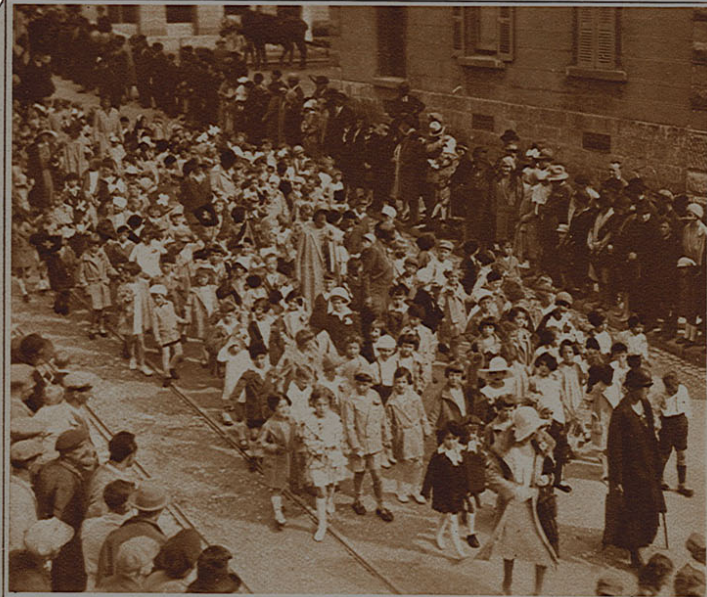
La Fête de la Jeunesse à La Chaux-de-Fonds. — Les tout petits.

TARIF DES ABONNEMENTS : Suisse : 3 mois = fr. 3.80 / 6 mois = fr. 7.50 / 1 an = fr. 15.— On peut s'abonner dans tout bureau de poste suisse. Compte de chèques postaux: Lausanne No 11/219. Téléphones: Lausanne 228.51; Zofingue 75. — Etranger : a) France continentale: 3 mois = fr. franq. 20.— 6 mois = fr. franq. 40.— / 1 an = fr. franq. 80.— Ces montants sont payables à MM. Ringier & Cie. St-Louis, Ht-Rhin, compte de chèques postaux No 5504, Strasbourg. — b) Autres pays: 3 mois = fr. suisses 6.40 6 mois = fr. suisses 12.70 / 1 an = fr. suisses 25.40. Ces montants sont payables par mandat international ou par chèque à l'ordre de l'Administration de «L'Illustré», à Zofingue (Suisse) ou encore par l'entremise d'une banque suisse ou d'un correspondant résidant en Suisse. On peut aussi s'abonner dans tout bureau de poste des pays faisant partie de l'Union postale universelle. — ANNONCES. — La ligne-millimètre, 1 col., 40 cts (Etranger: 50 cts.). Espaces réservés: 50 cts. (Etranger: 60 cts.). La clôture de la réception des annonces a lieu 12 jours avant la parution du journal. — PARTIE REDACTIONNELLE. — Nos illustrations et textes ne peuvent être reproduits sans notre autorisation. La clôture des pages illustrées a lieu le lundi à midi. / Directeur: Dr H. Brack. — Editeur: «L'Illustré» S. A., 27, rue de Bourg, Lausanne. / Rédacteur: Robert Terrisse.