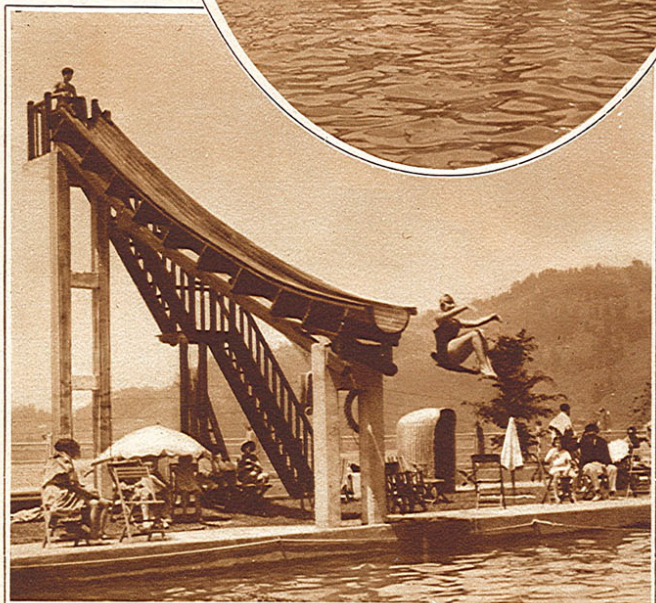
Le toboggan de Villars.