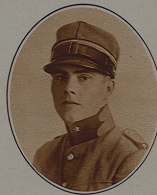
† Lt-aviateur Borloz. Un triste accident a jeté la consternation parmi les troupes d'aviation en service à Payerne: le lieutenant René Borloz, qui pilotait un Dewoitine D 19, a fait une chute mortelle. On attribue cet accident à un départ trop cabré.