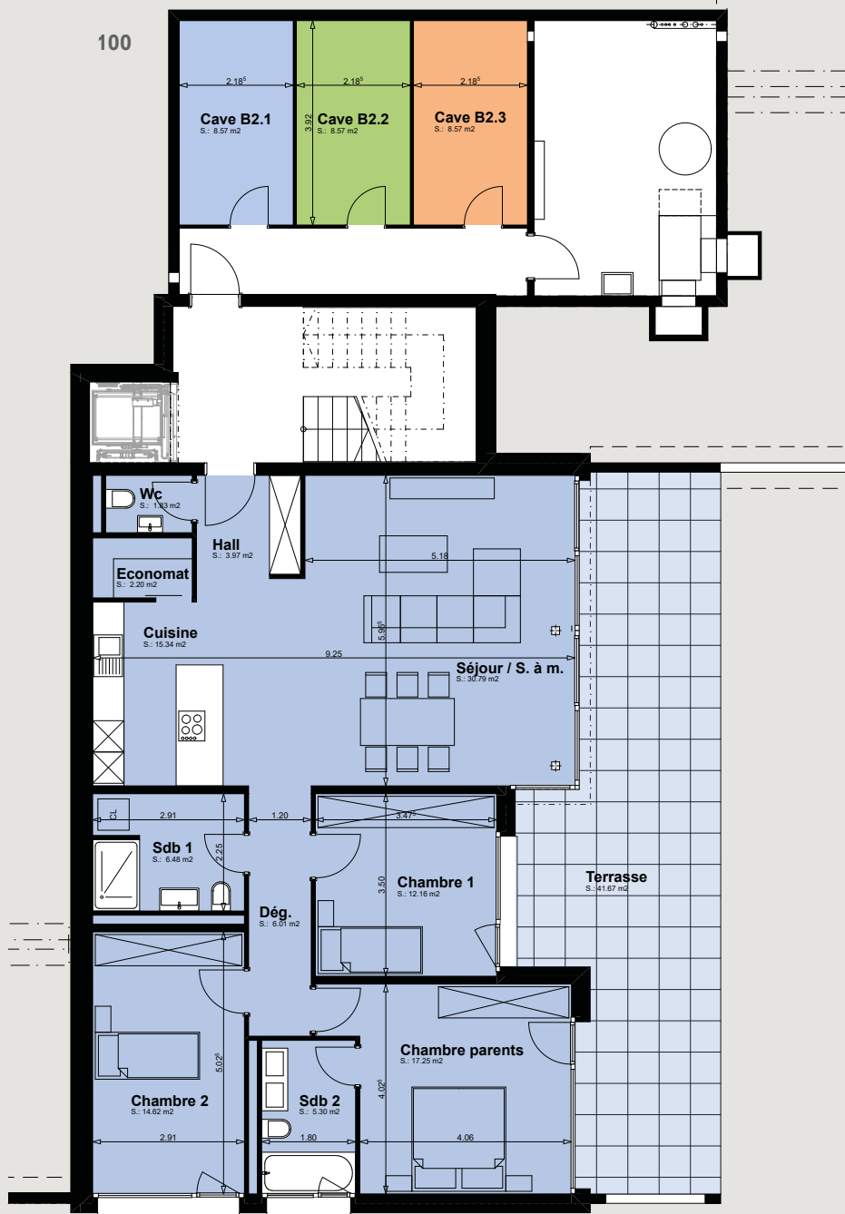
Bâtiment B2 / Façade nord-ouest