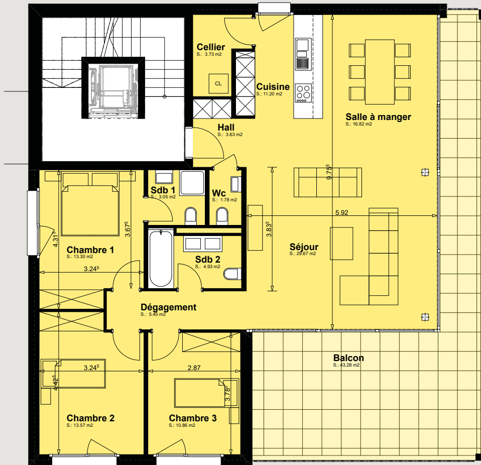
Bâtiment A1 / Façade nord-ouest