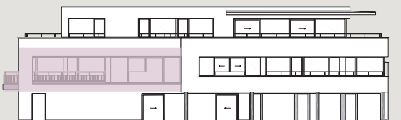
Bâtiment C / Façade ouest

Les surfaces des lots sont comprises à l'intérieur des murs bruts des façades & séparations entre appartements/cage d'escalier/ascenseur. Les balcons sont comptés pour moitié et les terrasses sont comptées pour un tiers.