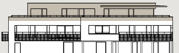
Bâtiment B / Façade ouest

Les surfaces des lots sont comprises à l'intérieur des murs bruts des façades & séparations entre appartements/cage d'escalier/ascenseur. Les balcons sont comptés pour moitié et les terrasses sont comptées pour un tiers.