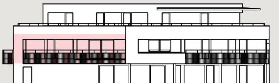
Bâtiment B / Façade ouest

Les surfaces des lots sont comprises à l'intérieur des murs bruts des façades & séparations entre appartements/cage d'escalier/ascenseur. Les balcons sont comptés pour moitié et les terrasses sont comptées pour un tiers.