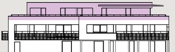
Bâtiment A / Façade ouest

Les surfaces des lots sont comprises à l'intérieur des murs bruts des façades & séparations entre appartements/cage d'escalier/ascenseur. Les balcons sont comptés pour moitié et les terrasses sont comptées pour un tiers.