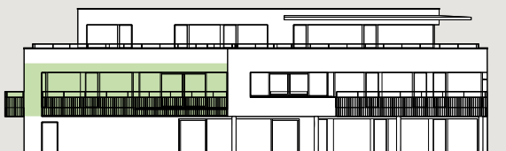
Bâtiment A / Façade ouest

Les surfaces des lots sont comprises à l'intérieur des murs bruts des façades & séparations entre appartements/cage d'escalier/ascenseur. Les balcons sont comptés pour moitié et les terrasses sont comptées pour un tiers.