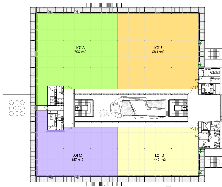
VARIANTE C COMPARTIMENTAGE 2EME ETAGE 1:350