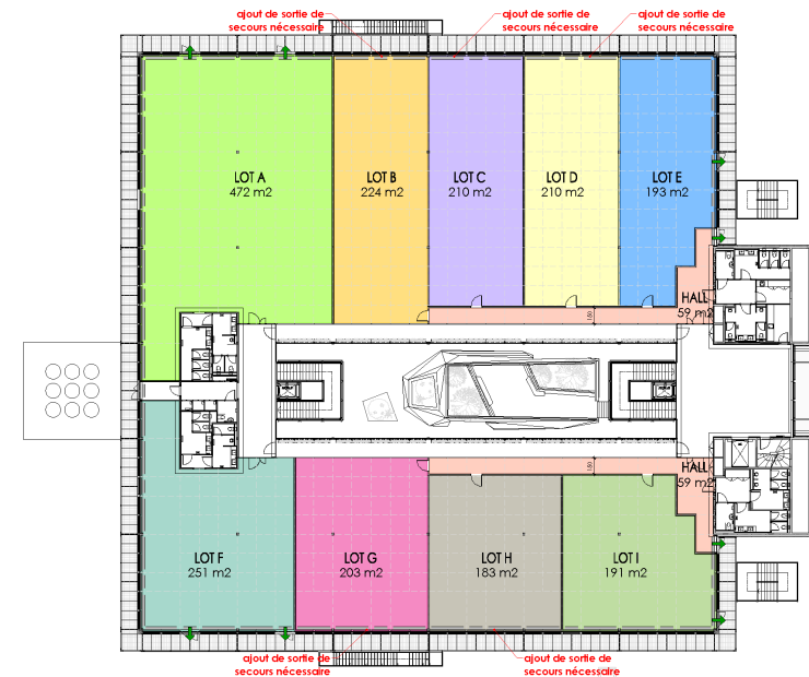
VARIANTE E COMPARTIMENTAGE 2EME ETAGE 1:350